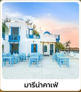
มารีนาคาเฟ่