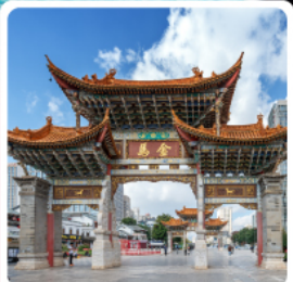
ประตูน้ำทองไถ่หยก