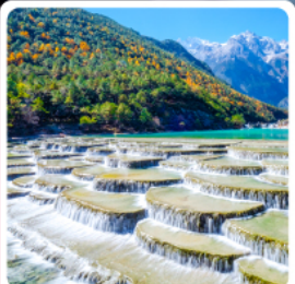
ทะเลสาบไป๋ส่วยเหอ