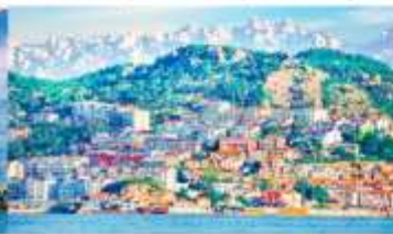
หมู่บ้านชาวประมงซาจื่อโซว