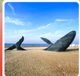
วาฬฟู่โอดเดี่ยว