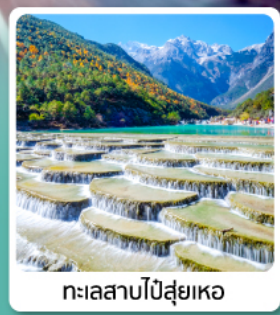
ทะเลสาบโป๋ส่วยเหอ