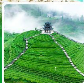
ไร่ชาอู่เจียโต