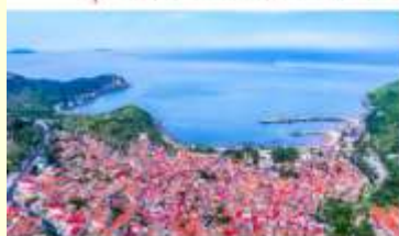
หมู่บ้านชาวประมง