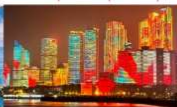
อ่าวฟู่ซาน