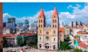
โบสถ์คริสต์เซนต์ไมเคิล

*ทางบริษัทฯ ขอสงวนสิทธิ์ในการสลับโปรแกรมทัวร์ตามความเหมาะสมขึ้นอยู่กับสถานการณ์หน้างาน โดยคำนึงถึงผลประโยชน์ของลูกค้าเป็นสำคัญ