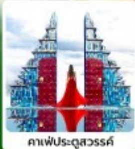
คาเฟ่ประตูสวรรค์