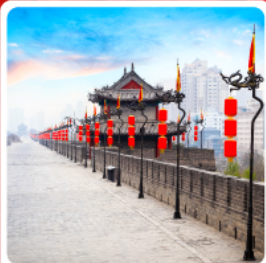
กำแพงเมืองโบราณซีอาน