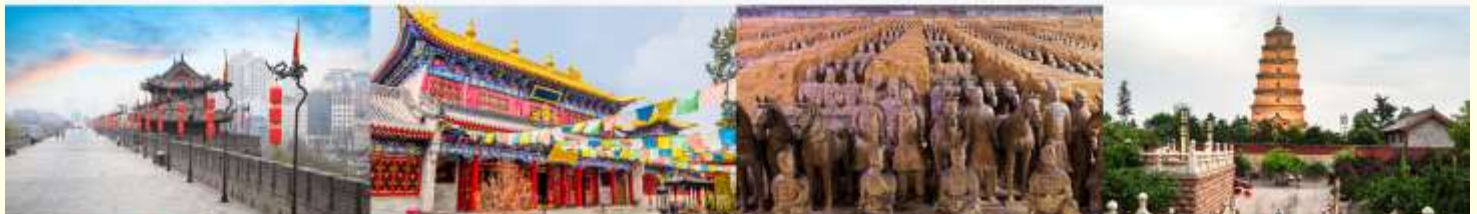
กำแพงเมืองโบราณ