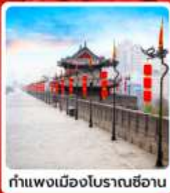
กำแพงเมืองโบราณซีอาน