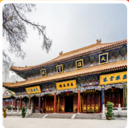
วัดต้าซิงซาน