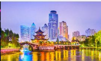
หอเจี่ยเซียวโหลว