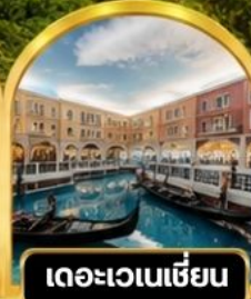
เดอะเวเนเชียน