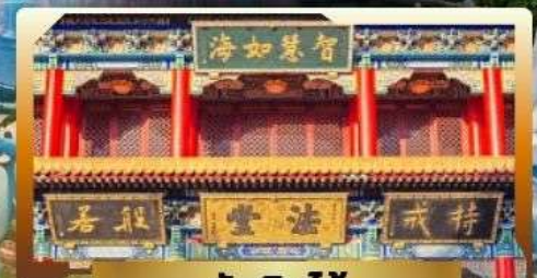
วัดจินไท่