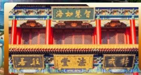
วัดจันทน์