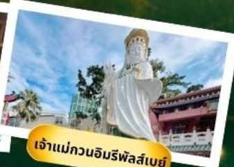
เจ้าแม่กวนอิมริพัลส์เบย์