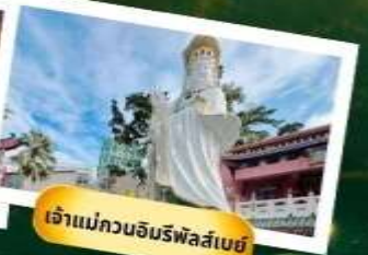
เจ้าแม่กวนอิมรฟัสสึเบย์