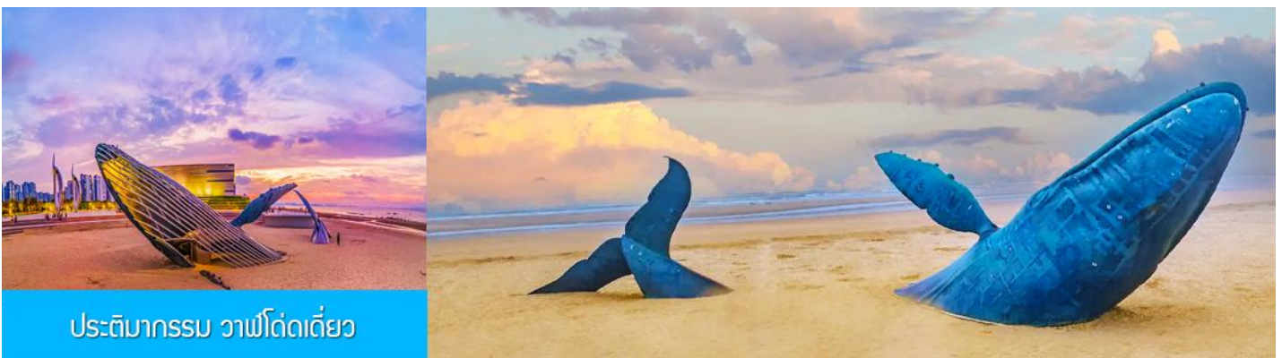
ประติมากรรม วาฟี่โดดเดี่ยว

นำท่านชมชুমู่ประตูฝั่งไหล พระราชวังมังกร พระราชวังราชินีแห่งสวรรค์ และศาลาหลัก ชมทัศนียภาพอันตระการตาของเขตแดนทะเลเหลือง-ทะเลป้อไห่ ชม "ศาลาอมตะทะยานสู่ท้องฟ้า" จากนั้นนำท่านเดินทางไปยัง จุดชมวิวกว๊านเฉียนข้ามทะเล ชมสถานที่สำคัญอันเป็นสัญลักษณ์ เช่น หอคอยเฉียนหยวน กำแพงแปดเฉียน และศาลาฮู่เฉียน โครงสร้างรูปทรงน้ำเต้าที่ล้อมรอบด้วยทะเลทั้งสามด้าน เชื่อมโยงตำนานแปดเฉียนเข้ากับ ความมหัศจรรย์ของภาพลวงตา