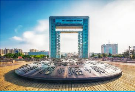
ประตูแห่งโชค

ครบรอบ 100 ปี ของการเปิดท่าเรือเว่ยไห่ จึงขนานนามว่าเป็น ประตูแห่งโชค ที่คอยต้อนรับนักเดินทางทุกท่าน โครงสร้างของประตูที่ตั้งตระหง่าน โอบล้อมของท้องทะเลและเกาะหลิวกง อยู่เบื้องหน้า เป็นภาพที่สวยงาม ให้ท่านเก็บบรรยากาศเป็นที่ระลึก จากนั้นเดินทางสู่ภัตตาคาร