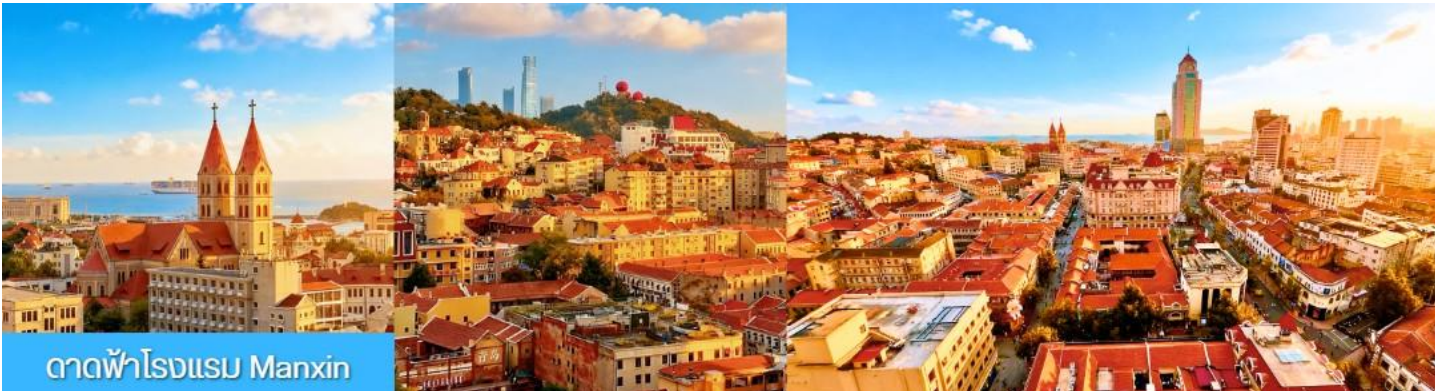
ตาดฟ้าโรงแรม Manxin

กลางวัน อิสระอาหารเพื่อให้ท่านมีความสุขในการเดินช้อปปิ้ง และท่านสามารถเลือกชิมอาหารพื้นเมืองตามอัธยาศัย จนได้เวลาอันสมควร ตามเวลานัดหมาย นำท่านเดินทางสู่ ถนนหลงเจียงลู่ ให้ท่านถ่ายรูป ถนนหลงเจียงลู่ ถนนสายการ์ตูน อะนิเมะ น่ารัก ๆ เหมาะกับการถ่ายรูป เซ็คอิน