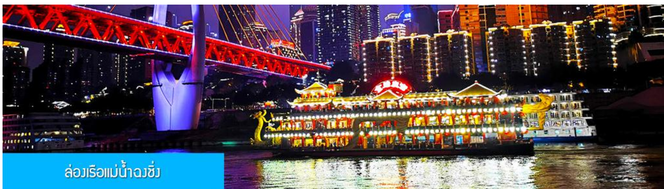
ล่องเรือแม่น้ำจางซี

OPTIONAL TOUR ไกด์ชายโปรแกรมเสริมล่องเรือชมความสวยงามของสองริมฝั่งแม่น้ำเมืองจงชิ่ง เมืองที่มีสมญานามว่ามีวิวยามค่ำที่สวยงามที่สุดแห่งหนึ่งของจีน รวมอาหารมื้อเย็น (สุกั๋หม่าล่าต้นตำหรับจงชิ่ง)