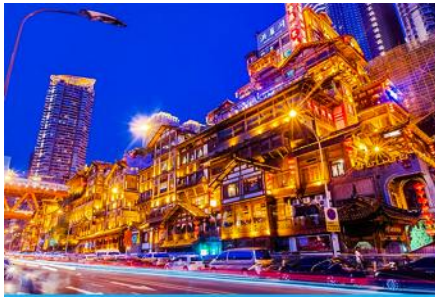
ย่านหงหยาดัว