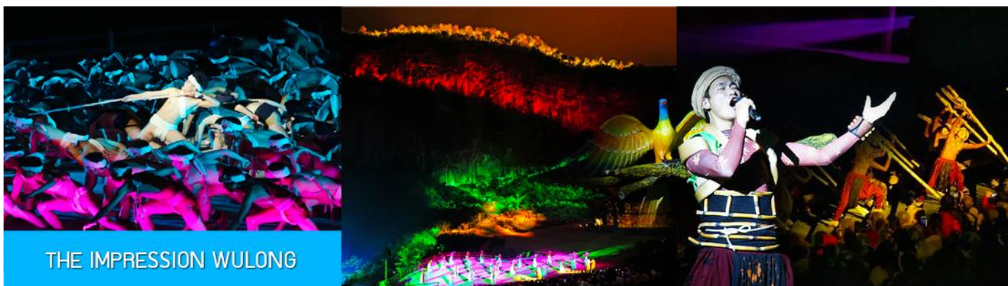
THE IMPRESSION WULONG

OPTIONAL TOUR ไกด์ชายโปรแกรมเสริมบัตรชมการแสดง ชุด ความประทับใจเมืองอู่หลง THE IMPRESSION WULONG หนึ่งในการแสดงที่ดีที่สุดของจีน ที่กำกับโดยผู้กำกับชื่อดัง จางยีโฮมว