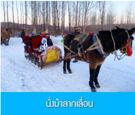
นั่งม้าลากเลื่อน

เที่ยง รับประทานอาหารกลางวัน ณ ภัตตาคาร (5)