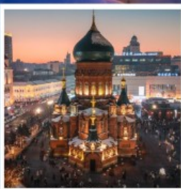
โบสถ์โซเฟีย