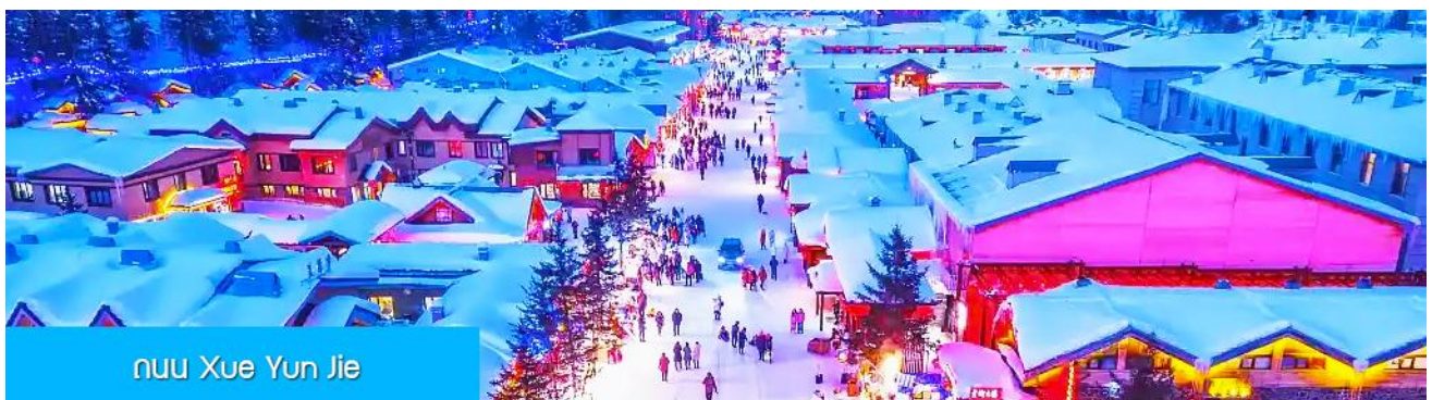
nuu Xue Yun Jie