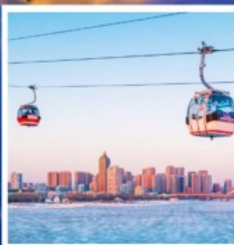
นั่งกระเช้าชมแม่น้ำซงฮวาเจียง