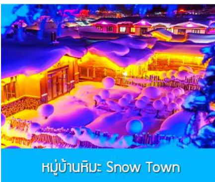
หมู่บ้านหิมะ Snow Town

ท่ามกลางท้องทุ่งและผืนป่าที่ปกคลุมด้วยหิมะราวกับอยู่ในโลกแห่งเทพนิยาย ผ่านหมู่บ้าน เวยหูจ้าย 威虎寨 ที่อดีตเคยเป็นที่ตั้งของรังโจรที่มักออกปล้นสะดมชาวบ้าน ม้าลากเลื่อนเป็นยานพาหนะเฉพาะพื้นที่ ๆ ที่นิยมนำมาใช้ในการเดินทางหรือลำเลียงสิ่งของในช่วงฤดูหนาว ที่ใช้ม้ามาลากงู้งแคร่เลื่อนให้สามารถเคลื่อนย้ายบนลานหิมะได้