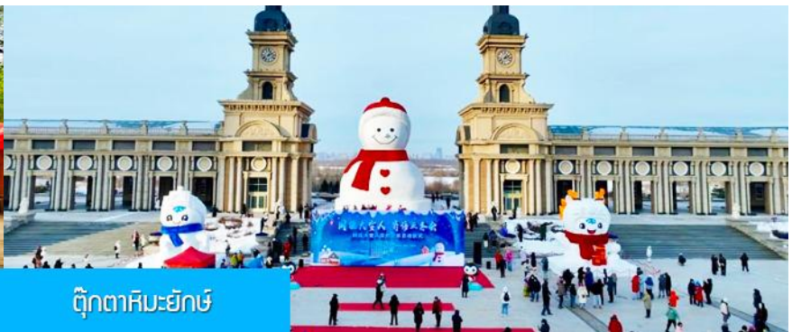
ตุ๊กตาคิมะยักษ์