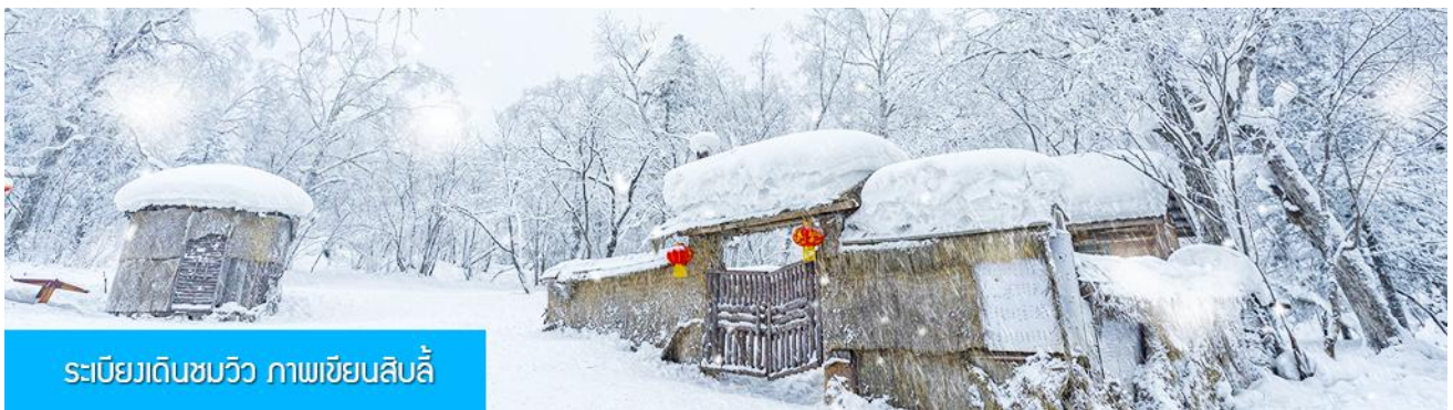
ระเบียบดินชมวิวก ภาพเขียนสิบสี่