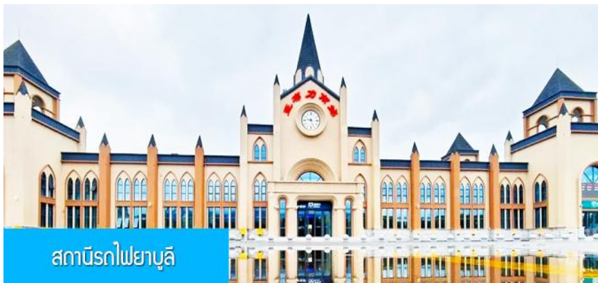
สถาปัตยกรรมไฟยาบูลี

หมายเหตุ เพื่อความสะดวกในการเข้าพักใน HOME STAY ภายในหมู่บ้านหิมะ ทางทัวร์แนะนำให้ท่านจัดเตรียมเสื้อผ้าและเครื่องใช้เท่าที่จำเป็น 2 ชุดใส่กระเป๋าใบเล็กหรือเป้แบบสะพายได้ เพื่อสะดวกในการนำติดตัวไปใช้สำหรับคืนที่นอนในหมู่บ้านหิมะ หากนำกระเป๋าเดินทางใบใหญ่เข้าสู่ที่พักในหมู่บ้านอาจสร้างความไม่สะดวกแก่ท่าน จึงไม่แนะนำ