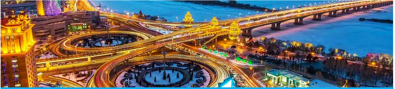
นครฮาร์บิน