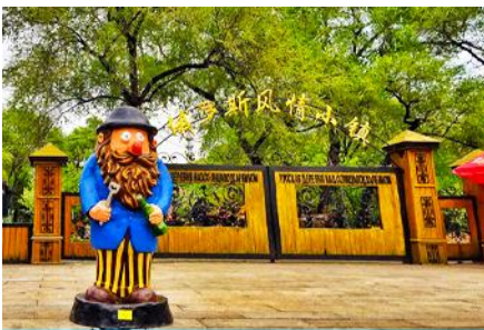
หมู่บ้านรัสเซีย

ตั้งอยู่บนเกาะพระอาทิตย์ 位于太阳岛上 เมื่อนักท่องเที่ยวมาเยือนในหมู่บ้านเสมือนท่านกำลังเดินเล่นอยู่ในหมู่บ้านหนึ่งใน รัสเซีย