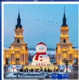
ตึกตาสหิมะยักษ์