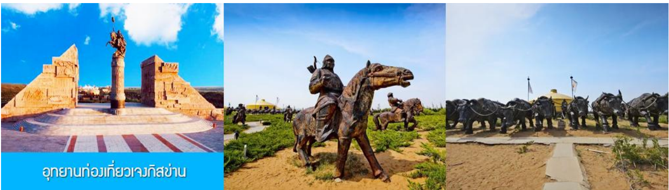
อุทยานท่องเที่ยวเจงกิสข่าน