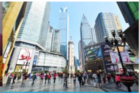
ย่านเจียฟางเปย