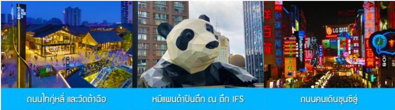
ถนนไท่กุ่หลี่ และวัดต้าฉือ