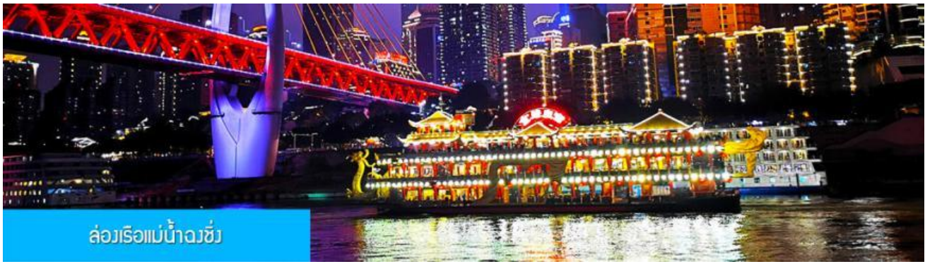
ล่องเรือแม่น้ำจิงซี

OPTIONAL TOUR ไกด์ขายล่องเรือแม่น้ำจิงซี ชมความสวยงามของสองริมฝั่งแม่น้ำเมืองจิงซี ล่องเรือ ท่านละ 280 หยวน หรือประมาณ 1,400 บาท