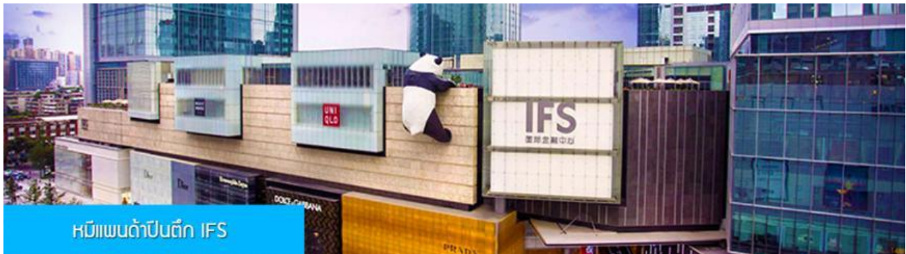
หมีแพนด้าปีนตึก IFS