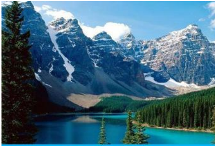
ภูเขาเทียนชาน

พักที่ HAMPTON BY HILTON URUMQI HOTEL โรงแรมระดับ 4 ดาวหรือเทียบเท่าในเมืองอูรุมฉี