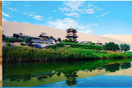
สระน้ำวังพระจันทร์