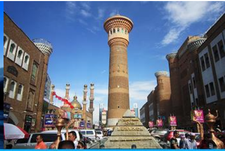
ตลาดต้าปาจา