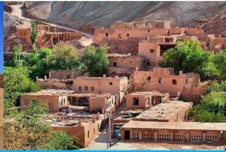
หมู่บ้านอูยгур

วันที่หก ชมระบบชลประทานคู่หูฟาน – ถ้ำพระพันองค์- เมืองโบราณเกาซางคู่เจิง-หมู่บ้านอูยгур –เดินทางสู่เมืองอูรูมฉี