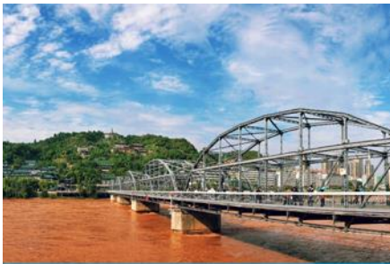
สะพานข้ามแม่น้ำฮวงโห