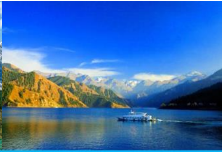
ล่องเรือทะเลสาบเทียนฉือ