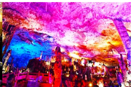
ถ้ำเก้าสวรรค์ควี่เวียเทียนตัง