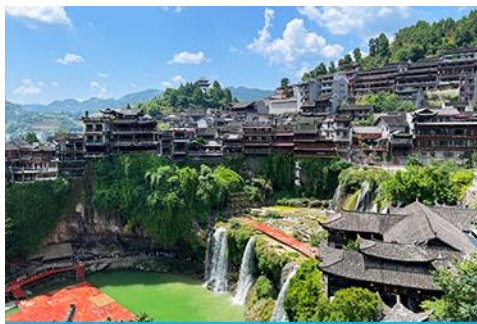
เมืองโบราณ ผู่หรงเจิ้น