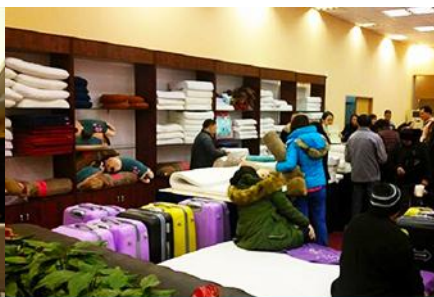
ศูนย์จำหน่ายผลิตภัณฑ์ยางพารา