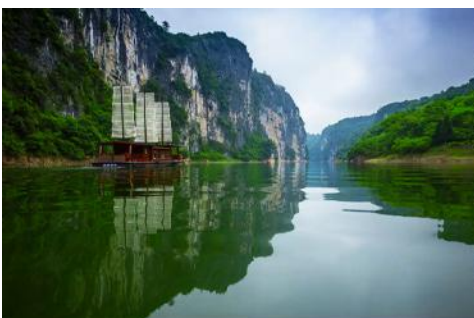
ล่องเรือ เหมาเหยียนเหอ