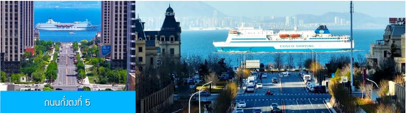
ถนนกั๋วตงที่ 5