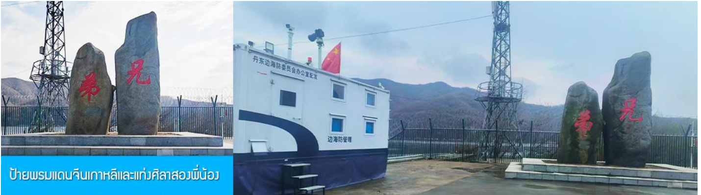
ป้ายพรมแดนจีนเกาหลีและแท่งศิลาสองพี่น้อง