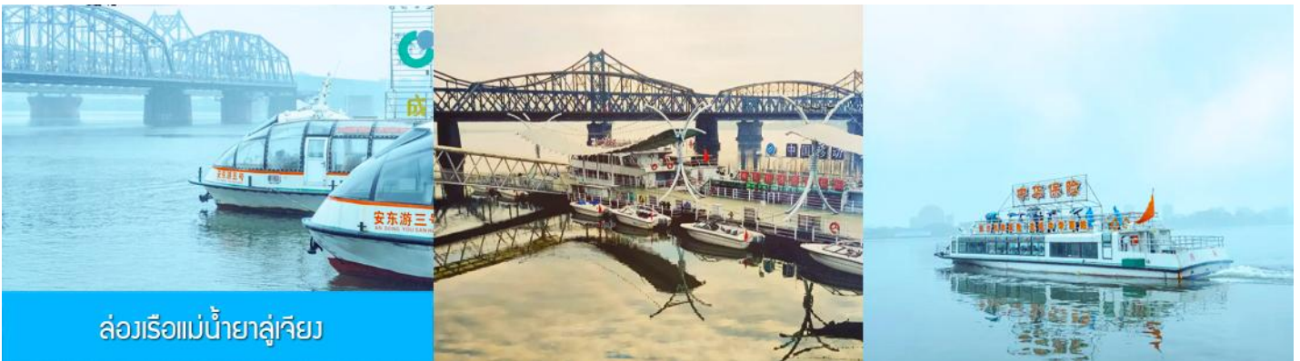
ล่องเรือแม่น้ำยาลูเจียง

หลังอาหารให้ท่านพักผ่อนตามอัธยาศัยในโรงแรม