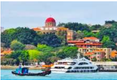
เกาะกู่ลิ่งหยี่

พักที่ โรงแรม XIAMEN HENGLONG HOTEL 4* หรือเทียบเท่าในเซี่ยเหมิน