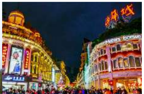
ถนนคนเดิน จวซาลู่