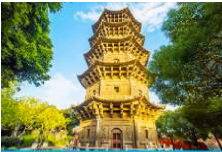
วัดโคหยวน