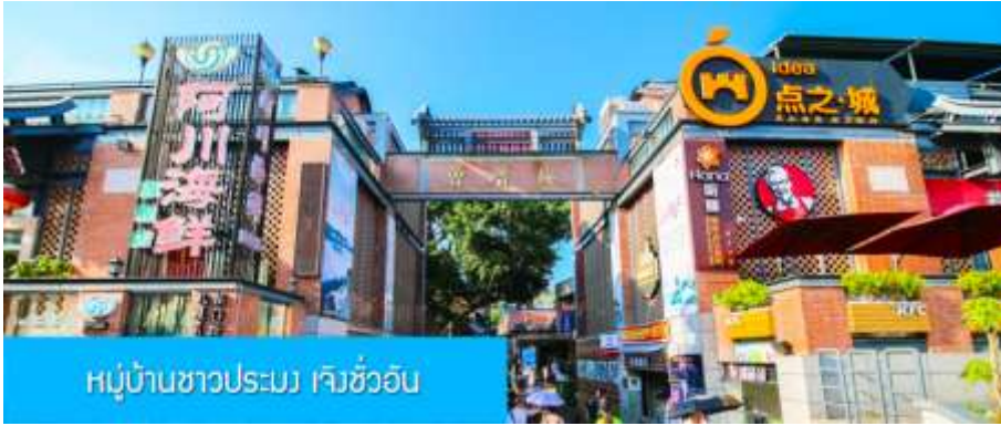
หมู่บ้านชาวประมง เจิงชว้ออัน