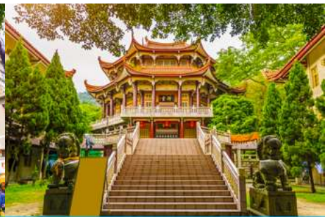
วัดหนานกั๋วซื่อ