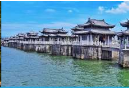
สะพานเซียงจื่อเจียว