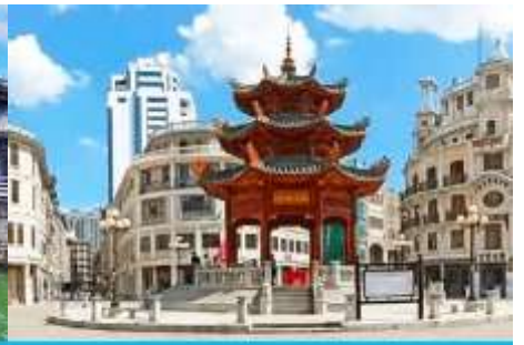
ย่านเมืองเก่าชัวเถา