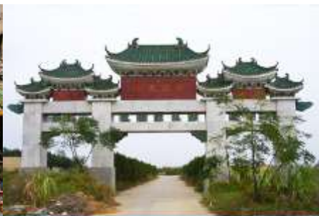
สุสานพระเจ้าตากสิน