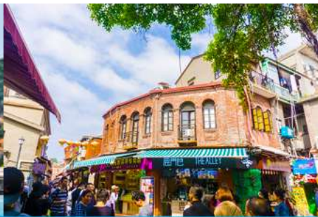
ถนนคนเดินหัวมังกร