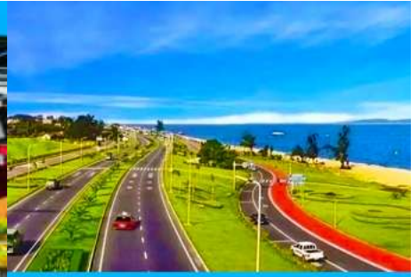
ถนนหวนเต่าลู่