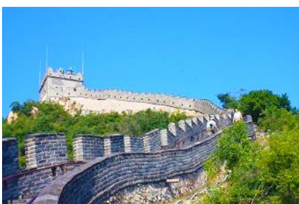
กำแพงเมืองจีนด่านวิยวกวน

พักที่ JINGLIN HTL OR HOLIDAY INN EXPRESS HTL 4* หรือ โรงแรมในระดับเดียวกันในกรุงปักกิ่ง