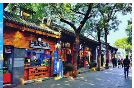
ชอยหนานหลิวกู่ชื่อยี่