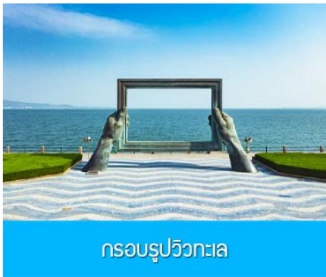
กรอบรูปวิวกทะเล