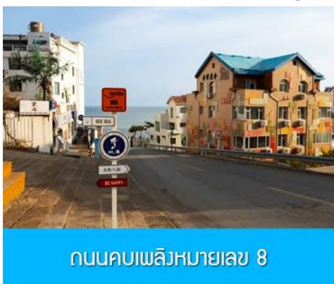
ถนนคบเพลิงหมายเลข 8

นำท่านชมสวนสาธารณะเวย์ไห่ 威海公园 สวนสาธารณะริมทะเลที่ใหญ่ที่สุดของเมืองเวย์ไห่ ให้ท่านชมและถ่ายภาพคู่กับ กรอบรูปยักษ์วิวกทะเล 威海公园大相框 แลนด์มาร์คที่เป็นอีกหนึ่งไฮไลท์ที่สุดฮิตของเวย์ไห่