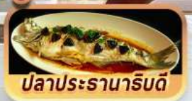
ปลาประรานาภิรมดี