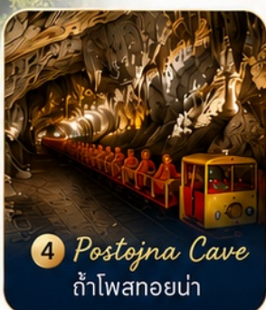
4 Postojna Cave ถ้ำโพสทอยน่า