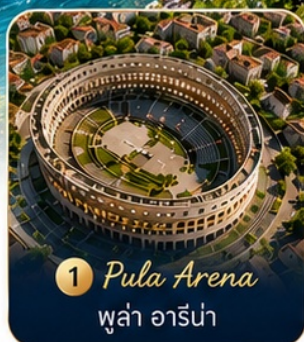
1 Pula Arena พูล่า อาร์น่า