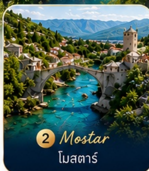
2 Mostar โมสตาร์