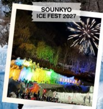
SOUNKYO ICE FEST 2027