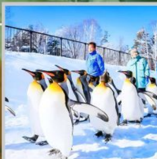
"PENGUIN ASAHIYAMA ZOO"