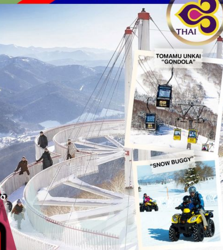
TOMAMU UNKAI "GONDOLA"