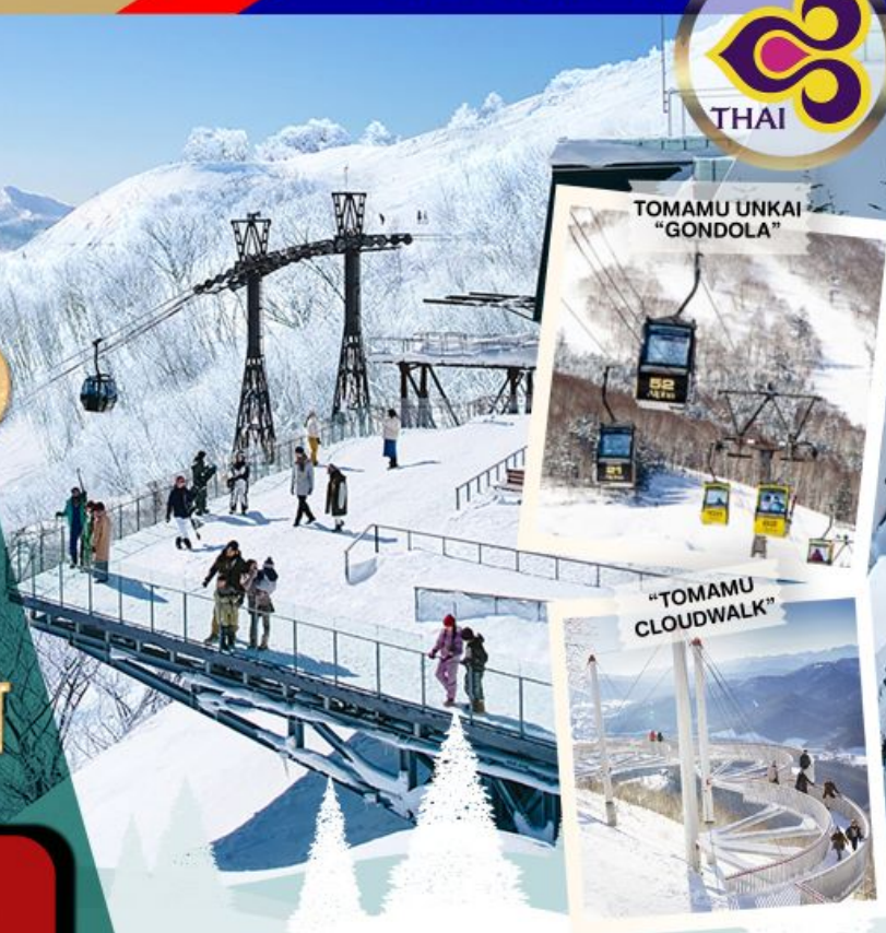
TOMAMU UNKAI "GONDOLA"