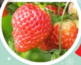
พิเศษ!! พักออนเซน 1 คืน