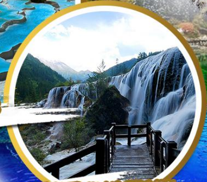
รถรถคนทออุทยาน