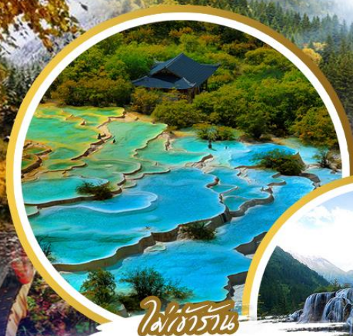
ไฟ้อร้อน