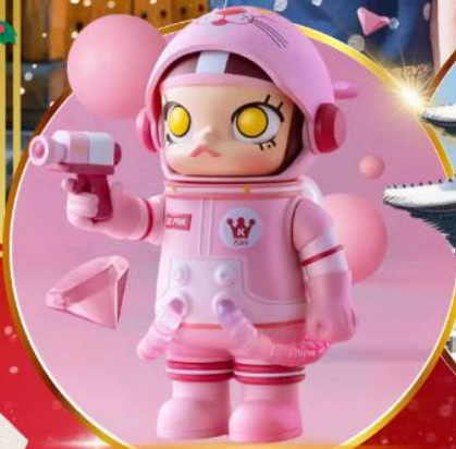
POP MART ฮงแด