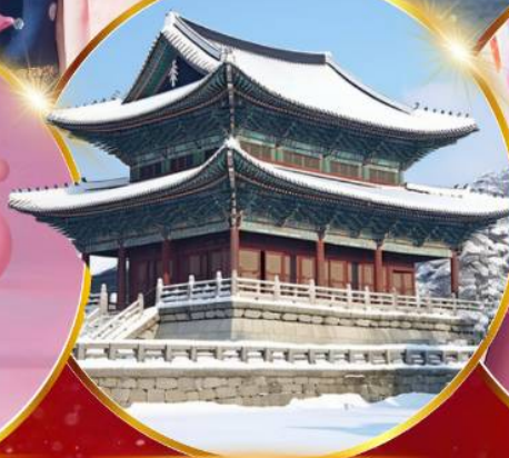
พระราชวังเคียงบกคุง