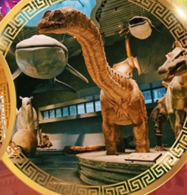
พิพิธภัณฑ์ธรรมชาติเซี่ยงไฮ้