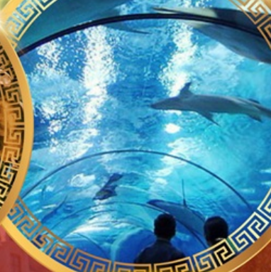
เซี่ยงไฮ้อาเซียนอะควาเรียม