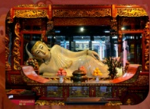
สักการะวัดพระหยกขาว