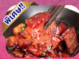
หมูสามชั้นน้ำแดง