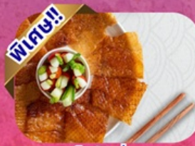
เป็ดปักกิ่ง