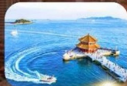
สะพานจันเจียว