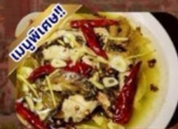
ปลาต้มพริกทอด