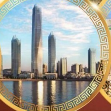
ชมวิวดาคารโฮตัน เซ็นเตอร์