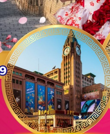
ถนนคนเดินหวังฝูจิ่ง

เที่ยวย่านการค้าดังกลางกรุงปักกิ่ง ถนนคนเดินหวังฝูจิ่ง จัตุรัสเทียนอันเหมิน พระราชวังกุ๊กกิง หอฟ้าเทียนถาน ช้อปปิ้งย่านซานหลี่ถุน พระราชวังฤดูร้อนอวิ๋เหอหยวน กำแพงเมืองจีนด่านอวิ๋หยงกวน ชมซากุระบาน สักการะวัดลามะ