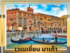
เวเนเซียน มาเก๊า