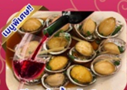
ซีฟู้ด เป้าฮ้อ+ไวน์แดง