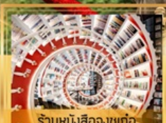
ร้านหนึ่งร้อยงูเก๋