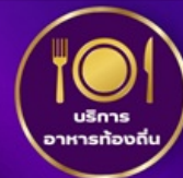
บริการ อาหารท้องถิ่น