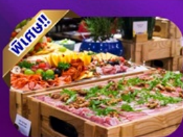
Buffet Dinner Banahill