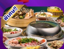
ซุฟไฟต์ชาบู