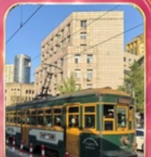
บั้งรถรางไฟฟ้าชมเมือง