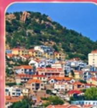
หมู่บ้านชาวประมงซาจื่อไว่