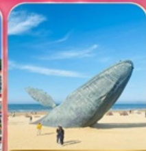
ประติมากรรม "วาฬผู้โดดเดี่ยว"