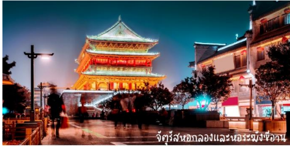
จัตุรัสนอกกำแพงและอนุสาวรีย์ซีอาน