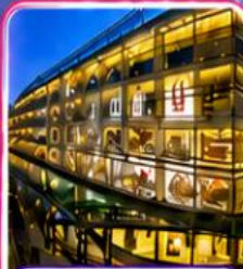
ห้างสรรพสินค้า การ์เด็นทวาทฮวน