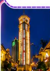
ตึกไครอิ่งไหลว