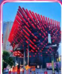
ศูนย์ศิลปะกะว๋โก๋