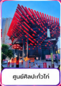
ศูนย์ศิลปะแก้วโก๋