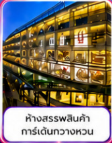
ห้างสรรพสินค้า การ์เด็นทวาทงหวน