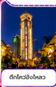
ตึกโควอชิงไหลว