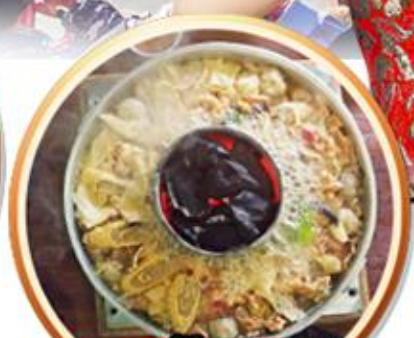
เมนูพิเศษ!! สุกี้เห็ดโตดำ+ปลาเซลมอน