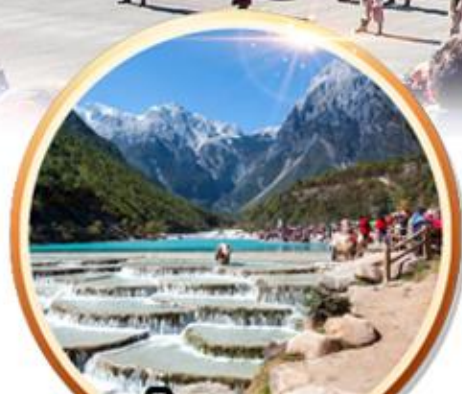
ยอดอมความงาม หุบเขาพระจันทร์สีน้ำเงิน