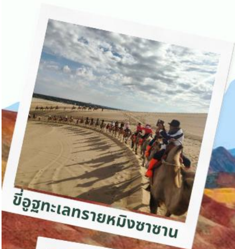
ขี่อูฐทะเลทรายหมิงซาซาน