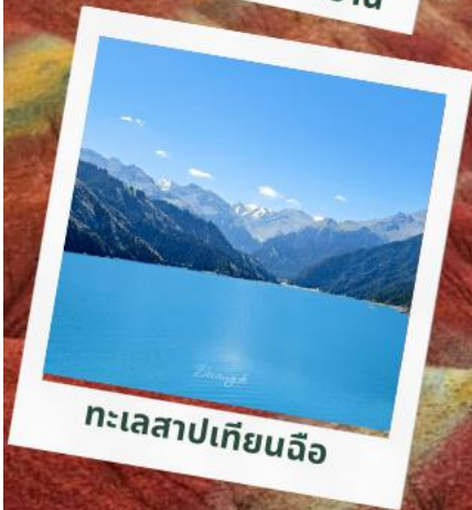
ทะเลสาปเทียนฉือ