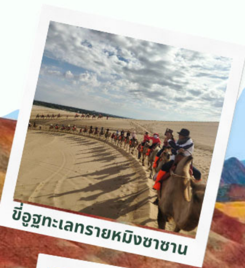
ขี่อูฐทะเลทรายหมิงซาซาน