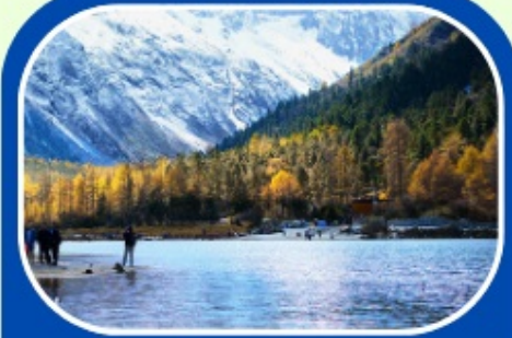
ปี่ผิงโกว