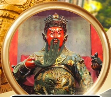
วัดกวนโท