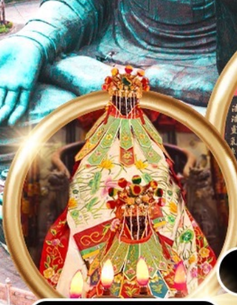
ยืมเงินเจ้าแม่กวนอิมสองห้า