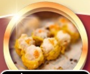
ติ่มซำต้นตำรับ