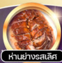
ห่านย่างรสเลิศ