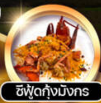
ซีฟู้ดกึ่งมิงกร