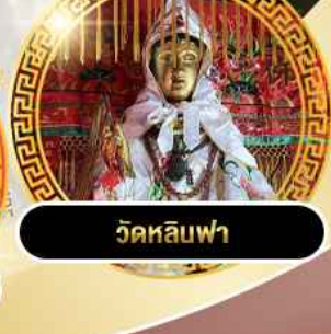
วัดหลิวฟา