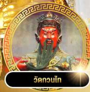
วัดกวนโก