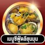
เมนูซีฟู้ดลิ้นจี่