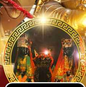
วัดบ้านโหมง