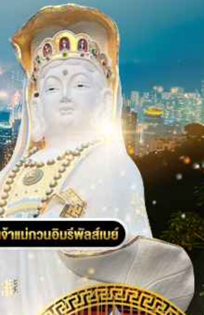
วัดเจ้าแม่กวนอิมรับเสด็จ