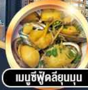
เมนูซีฟู้ดลิ้นจี่อบ